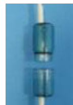
Рис. Б. Аромокапсула дифузора

Дифузор може використовуватись для кисневої ароматерапії. Для цього в ньому передбачена спеціальна розбірна аромокапсула (див. рис. Б). За необхідності в неї можна помістити губку, просочену ароматичною рідиною. Це допоможе зробити процедуру особливо приємною.