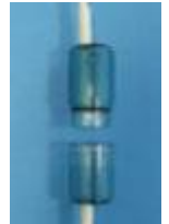
Рис. Б. Аромокапсула дифузора

Дифузор може використовуватись для кисневої ароматерапії. Для цього в ньому передбачена спеціальна розбірна аромокапсула (див. рис. Б). За необхідності в неї можна помістити губку, просочену ароматичною рідиною. Це допоможе зробити процедуру особливо приємною.